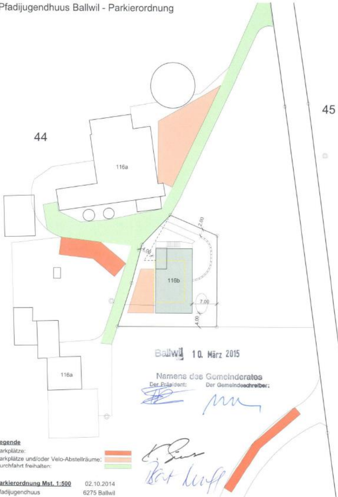
Pfadijugendhuus Ballwil - Parkierordnung